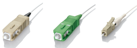
SC, 62,5/125 µm SC, polissage APC LC, 62,5/125 µm

Les cavaliers de liaison monomodes et multimodes de qualité économique de Leviton sont conçus pour prendre en charge les épissures soudées ou mécaniques pour les systèmes optiques. Les cavaliers de liaison sont offerts séparément ou en ensembles pour faciliter l'installation et la commande.