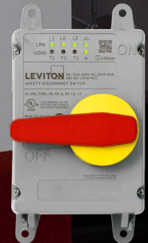
Dispositifs LEV à interverrouillage mécanique et technologie Inform