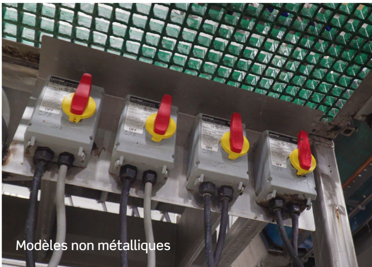
Modèles non métalliques