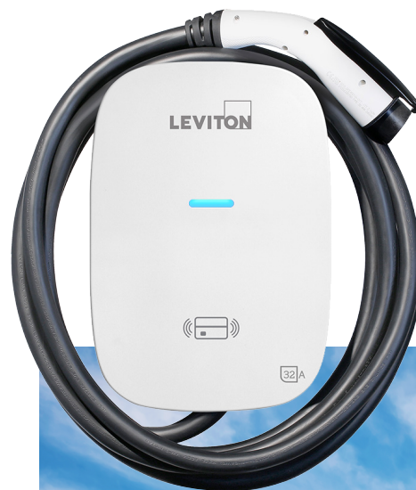
Borne de recharge résidentielle de niveau 2

Ces solutions sont conformes aux normes de l'industrie et compatibles avec les modèles de tous les grands fabricants (norme SAE J1772 MC ).