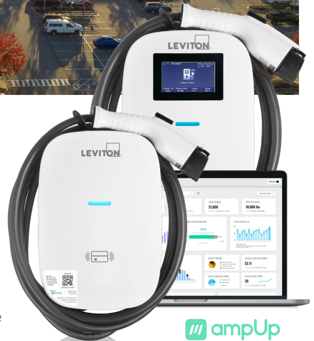
Borne niveau 2 Borne de recharge publique en réseau